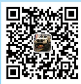
车辆装备产业联盟 微信公众号