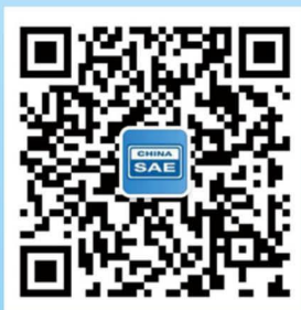
中汽学越野车技术分会