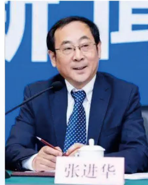
张进华 中国汽车工程学会 常务副理事长兼秘书长