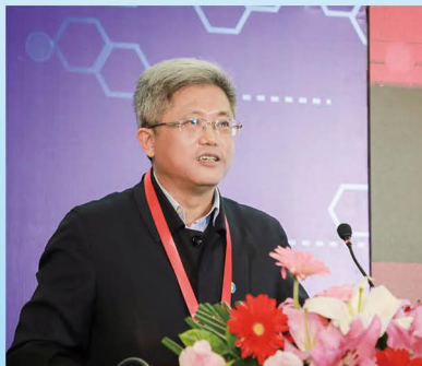
毛明 中国科学院院士 中国兵器首席专家 中国 99A 式主战坦克总设计师