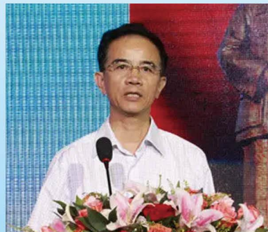
孙逢春 中国工程院院士 新能源汽车专家 电动车辆国家工程实验室主任