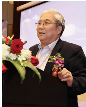
郭孔辉 中国工程院院士