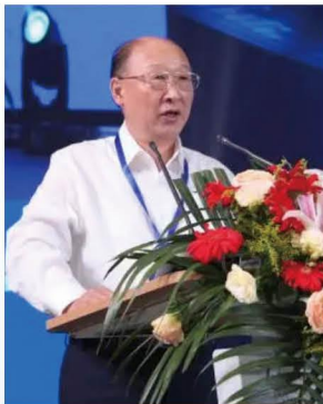
李骏 中国工程院院士 中国汽车工程学会理事长

国家相关部委、军队、武警、公安、应急救援等车辆装备部门专家和领导 高端、权威、专业的同期会议、大咖云集